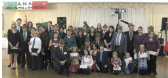
Soci con figli, nipoti, pronipoti dopo la consegna delle borse di studio.