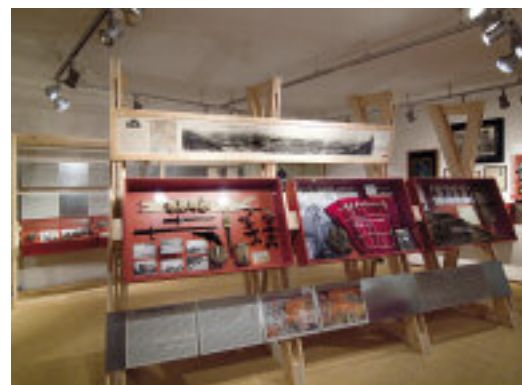
Uno scorcio della mostra.