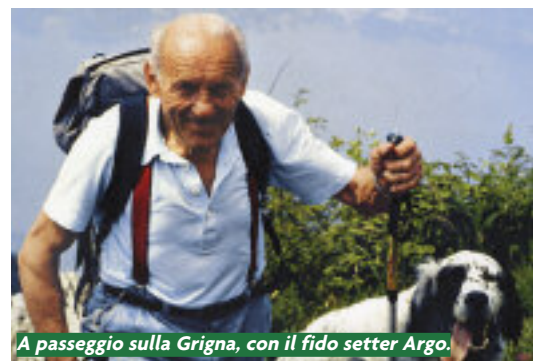
A passeggio sulla Grigna, con il fido setter Argo.