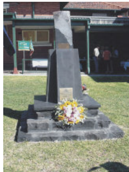
Il museo degli alpini e il cippo eretto in onore dei Caduti.