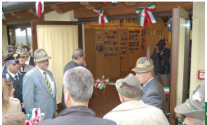
Il momento della benedizione della nuova sede del Gruppo.