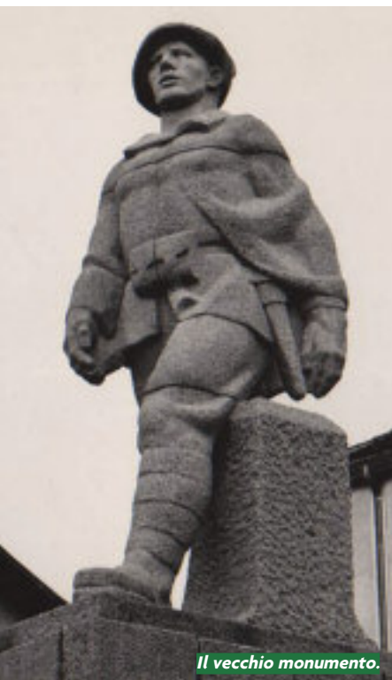
Il vecchio monumento.