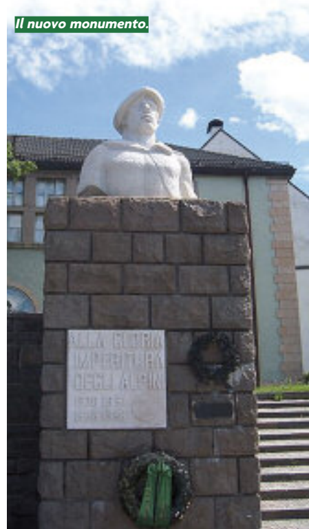
Il nuovo monumento.