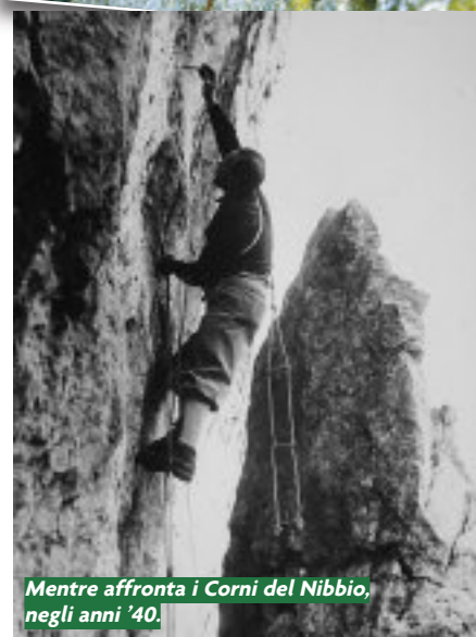
Mentre affronta i Corni del Nibbio, negli anni '40.