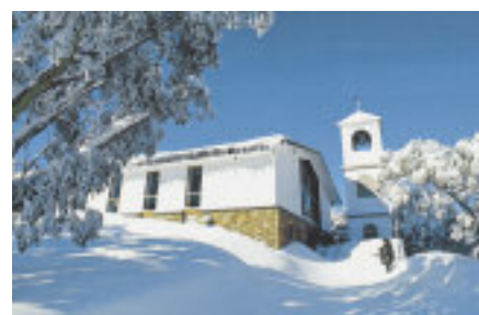
La chiesetta alpina.