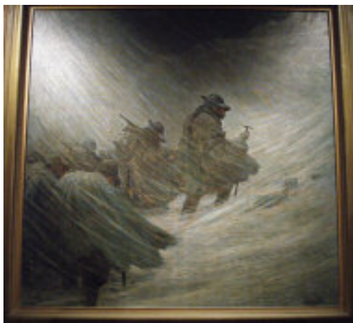
Il quadro "La Tormenta", di Severino Tremator, proprietà della sezione ANA di Genova, che è stato l'immagine principale della mostra (riprodotto su standardi, depliant e manifesti).

L'evento in poco più di due settimane ha fatto registrare una lusinghiera partecipazione di pubblico, valutato intorno alle dodicimila persone, tra cui numerose scolaresche, preventivamente sensibilizzate con una capillare serie di contatti con i rispettivi dirigenti didattici. Questo è stato indubbiamente il più grande successo per gli organizzatori, in quanto la mostra era stata specificamente studiata ed allestita per i giovani: niente di sensazionale o celebrativo, ma al contrario una commossa commemorazione di quanti furono trascinati in quella guerra, perdendovi purtroppo la vita. Di qui la scelta del titolo, La Trincea della Memoria : la trincea, che per molti giovani di novant'anni fa era stata luogo di sofferenza, in questa circostanza ha rappresentato in senso figurato un argine "per non dimenticare" un evento che