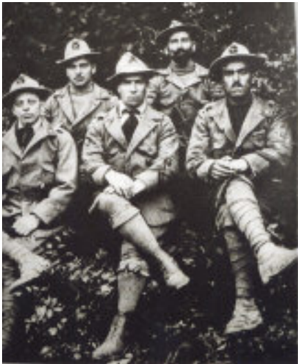
La squadra "Arditi fiamme verdi" del XXIX reparto d'assalto, entrata a Rovereto alle ore 20,30 del 2 novembre 1918.

La lunga epigrafe illustra con chiarezza l'origine del monumento. Fu l'esercito a volerlo e realizzarlo, per ricordare i Caduti dell'ultimo scontro per aprire la strada verso Trento e per celebrare quell'episodio estremo del grande conflitto. Ne trascriviamo il testo, uscendo dallo stile epigrafico, come se si trattasse di una semplice didascalia: "Qui gli arditi del 29° riparto d'assalto, gli alpini del 40° gruppo, battaglioni Feltre, monte Pavione, monte Avenis, gli artiglieri del 10° gruppo di montagna, audaci avanguardie della 32ª divisione (XXIX Corpo d'Armata), travolta la disperata resistenza austriaca, nel tramonto del 2 novembre 1918 balzarono vittoriosi oltre le linee nemiche aprendo all'Italia la via desiata di Trento. La Prima Armata, che alla redenzione del Trentino legò la sua storia di sangue e di gloria, volle qui ricordati i prodi che caddero sulle soglie della meta agognata".