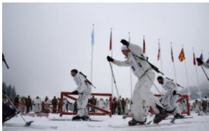
In queste foto, due fasi delle gare.