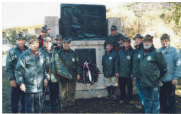
Gli alpini di Marco al monumento.

Lo scorso 16 novembre gli alpini del gruppo di Marco, un borgo a sud di Rovereto, hanno commemorato il 90° della fine della Grande Guerra con una cerimonia al monumento che ricorda l'ultimo scontro italo-austriaco, avvenuto nel paese il 2 novembre 1918. Fu l'ultimo assalto: il 3 novembre, dopo 40 mesi di guerra in prima linea, la città di Rovereto poté unirsi a Trento italiana.