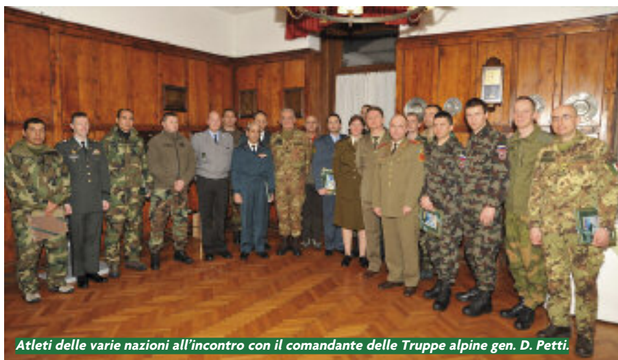
Atleti delle varie nazioni all'incontro con il comandante delle Truppe alpine gen. D. Petti.

A ncora una volta quel fantastico banco di prova che sono i campionati sciistici delle Truppe alpine (Ca.S.T.A.) hanno messo a confronto la preparazione delle truppe da montagna di diversi Paesi e ancora una volta gli alpini hanno dimostrato di essere all'altezza della considerazione confermata anche durante le missioni multinazionali di pace alle quale partecipano. I campionati si sono svolti dall'1 al 6 feb-