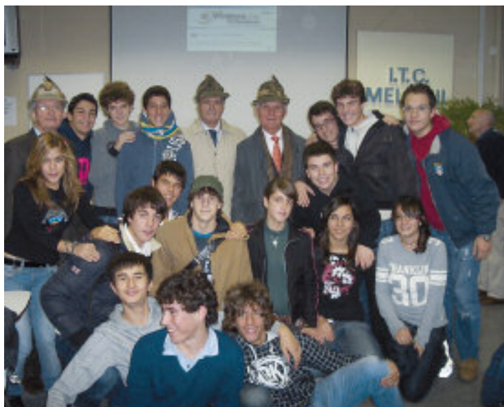
Istituto Tecnico Melloni: foto di gruppo di studenti e relatori alpini.