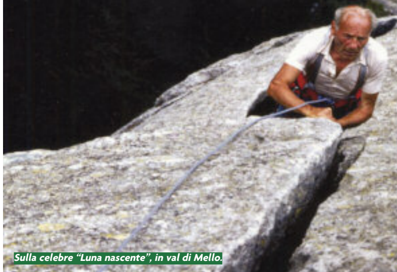
Sulla celebre "Luna nascente", in val di Mello.