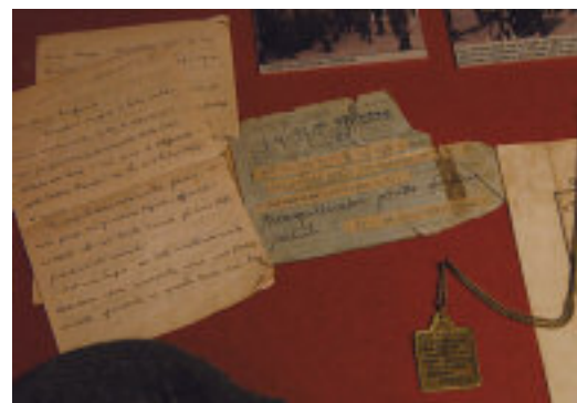
Una lettera e un telegramma spedite dalle retrovie.

hanno portato un'indescrivibile ondata di gioia ed entusiasmo rimasta intatta nella sua più pura e schietta specificità riproponendo un cameratismo ed un'aggregazione che ha la forza di coinvolgere tutti.