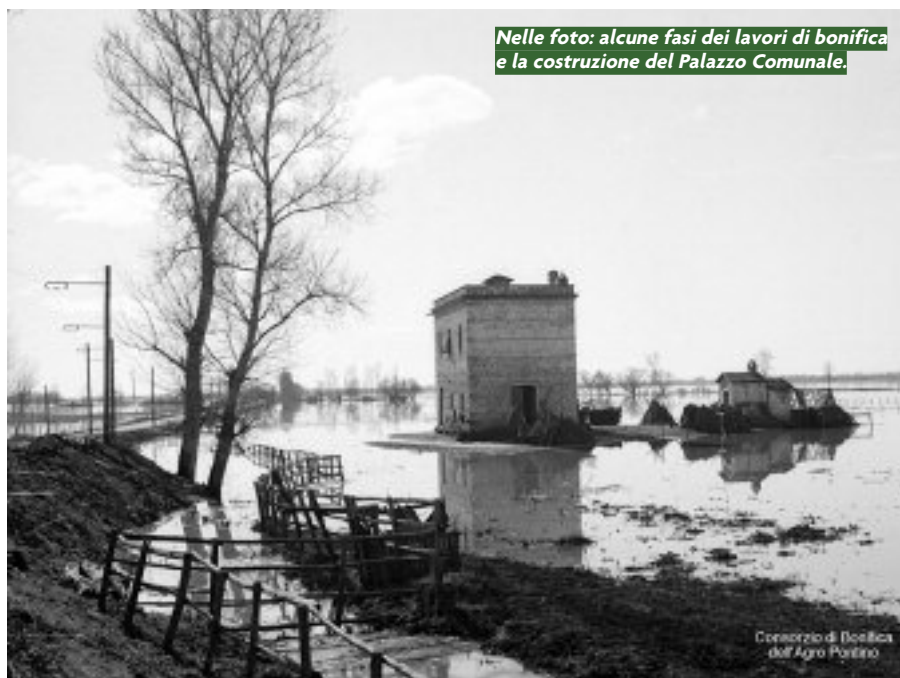
Nelle foto: alcune fasi dei lavori di bonifica e la costruzione del Palazzo Comunale.

L'attività vera e propria iniziò nel 1927, e i lavori da compiere erano titanici visto che si trattava di disciplinare e di pro-