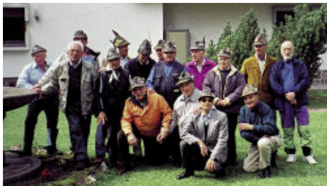
Cinquantaseiesimo raduno annuale degli alpini della cp. Comando, btg. Bolzano, 6° Alpini, 1°/30. Quest'anno si sono ritrovati al soggiorno alpino di Costalovara, sull'Altopiano del Renon.