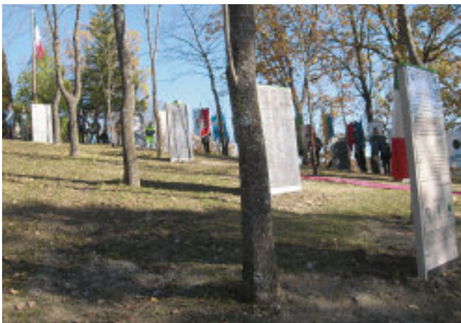
Le stele del Luogo della Memoria.