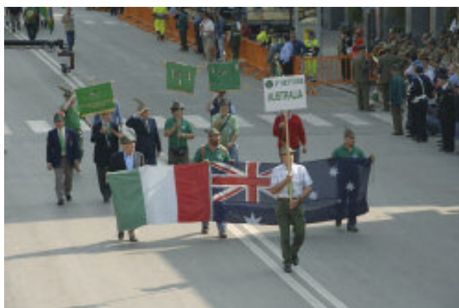
Il vessillo sezionale (il primo a sinistra) all'adunata di Cuneo.