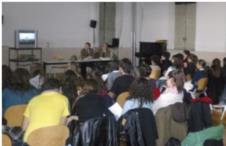
Liceo Romagnosi: la proiezione di un video storico.

È stata un'esperienza coinvolgente che ha arricchito tutti e ha destato grande curiosità e interesse tra gli alunni che hanno partecipato attivamente alle presentazioni e ai dibattiti, insieme ai loro professori. Il successo dell'iniziativa voluta dalla Sezione è stato garantito dalla grande disponibilità e competenza dei relatori e dall'accoglienza degli alunni e dei docenti. ●