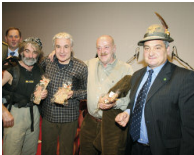
Nella foto: da sinistra Mauro Corona, Luigi Maieron, Toni Capuozzo e il presidente della sezione di Gemona Carlo Vozza.

La sezione di Gemona, su invito della sezione di Cividale e in collaborazione con il Comune di Gemona del Friuli ha organizzato, nell'ambito del progetto di solidarietà "Un ponte per Herat", una serata di beneficenza al cinema sociale messo a disposizione dal Comune. Il ricavato servirà per un'opera sociale in Afghanistan, pianificata su segnalazione degli uomini dell'8° reggimento alpini, in missione in Afghanistan nella provincia di Herat fino ad aprile (la cerimonia per il rientro del reggimento è prevista il 19 aprile a Cividale del Friuli). Tanti gli ospiti illustri intervenuti alla serata, alla cui organizzazione ha concorso il comune di Gemona del Friuli, e che è stata allietata dai brani del cantautore friulano Luigi Maieron, e da un affollatissimo show con il giornalista Toni Capuozzo e lo scrittore Mauro Corona. Lo spettacolo, "Tre uomini di parola", ha registrato il tutto esaurito. Sono stati venduti biglietti della lotteria, il cui ricavato è andato a sommarsi a quanto raccolto nelle precedenti tappe dell'iniziativa, ad opera anche di altre sezioni. ●