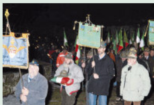
Il corteo degli alpini. Sotto, uno scorcio del Santuario.