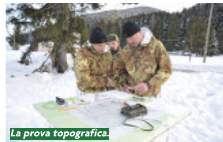
La prova topografica.