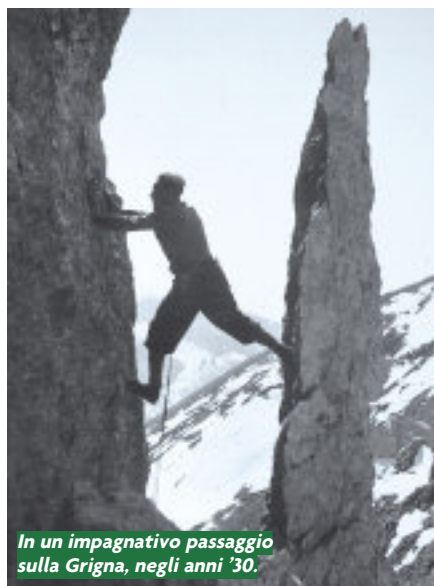
In un impagnativo passaggio sulla Grigna, negli anni '30.