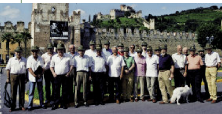
Foto di gruppo degli artiglieri del 49° corso AUC di Foligno che si sono dati appuntamento a Soave (Verona).