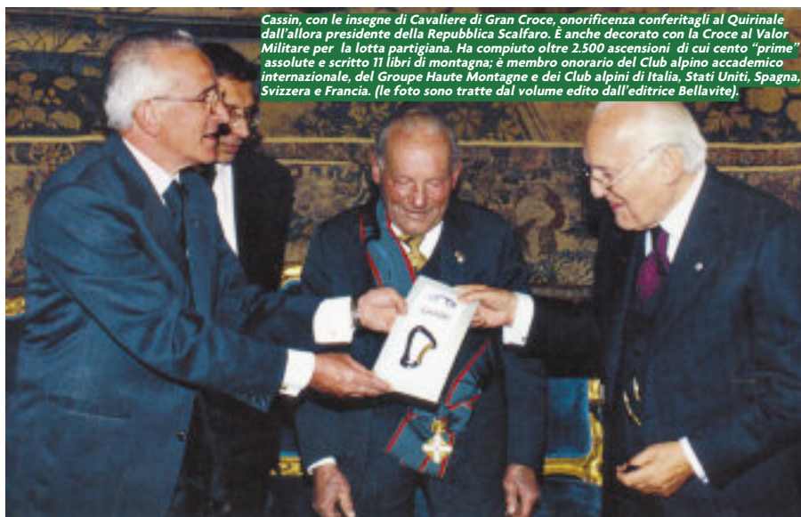
Cassin, con le insegne di Cavaliere di Gran Croce, onorificenza conferitagli al Quirinale dall'allora presidente della Repubblica Scalfaro. È anche decorato con la Croce al Valor Militare per la lotta partigiana. Ha compiuto oltre 2.500 ascensioni di cui cento "prime" assolute e scritto 11 libri di montagna; è membro onorario del Club alpino accademico internazionale, del Groupe Haute Montagne e dei Club alpini di Italia, Stati Uniti, Spagna, Svizzera e Francia.

salotto, ci sentiamo tra amici. È il momento degli autografi, ho portato alcune fotografie che ho scattato sulla sua via al Badile, lui le guarda e mi dice bravo, mi fa i complimenti!!! Cosa dovrei dire io a lui? Non ho parole, ma il groppo in gola e gli occhi lucidi. Piccolo omaggio a sorpresa, ovviamente abbiamo portato