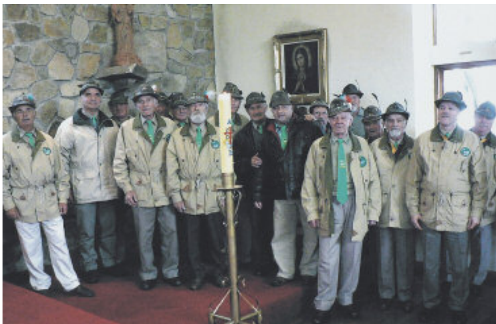
Un gruppo di alpini dopo la Santa Messa che viene officiata ogni anno nell'anniversario della costruzione della chiesetta.