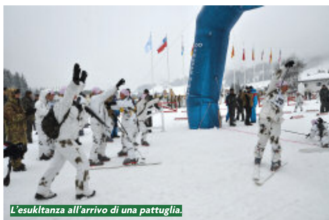
L'esultanza all'arrivo di una pattuglia.