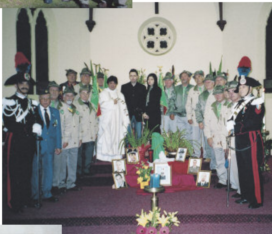
Messa in onore dei Caduti in Afghanistan (4 carabinieri e 2 alpini).

Gli alpini di Melbourne sperano ora di avere qualche giovane recluta proveniente dall'Italia, per tenere alto lo spirito alpino. ●