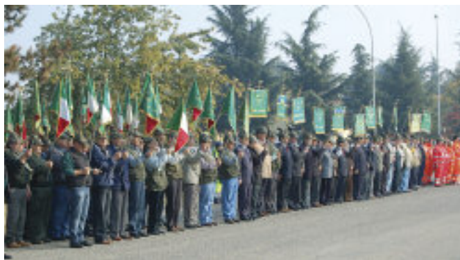
Lo schieramento dei vessilli e dei gagliardetti.