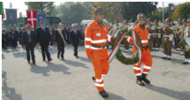
Il momento dell'onore ai Caduti.

Il prossimo appuntamento sezionale è a Rovescala. ●