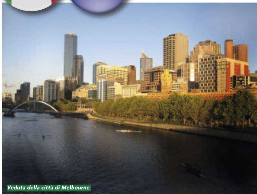
Veduta della città di Melbourne.

In questi anni i soci alpini erano 555, oltre a 87 amici, per un totale di 642 iscritti. Purtroppo tanti sono andati avanti, e questo ha creato dei vuoti tra i soci effettivi, anche se il numero degli iscritti è