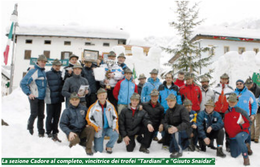
La sezione Cadore al completo, vincitrice dei trofei "Tardiani" e "Gisuto Snaidar".

Alla Sezione Cadore è andato anche il Trofeo speciale intitolato a "Gisuto Snaidar" per il miglior tempo complessivo nella categoria Master A1.