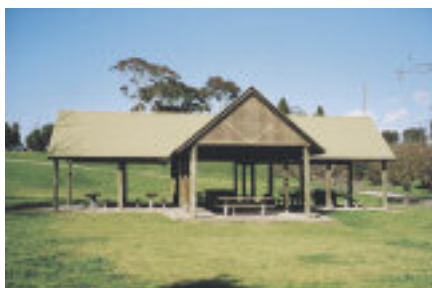
La baita alpina.