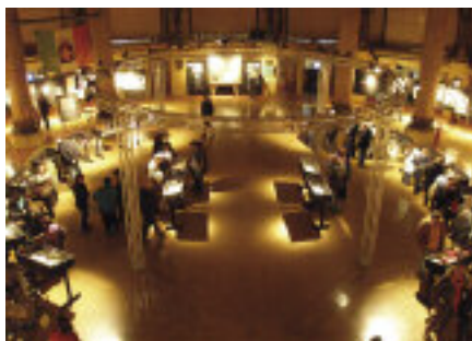
Veduta generale dell'ex Sala delle Grida con la mostra.

mutò il corso della storia e la vita di generazioni. Ricordo, o meglio memoria, che purtroppo i giovani d'oggi, non per colpa loro, stanno pericolosamente perdendo, insieme con i legami a storia e tradizioni del nostro Paese. In particolare, le visite delle classi (dalle medie inferiori ai maturandi dei principali licei cit-